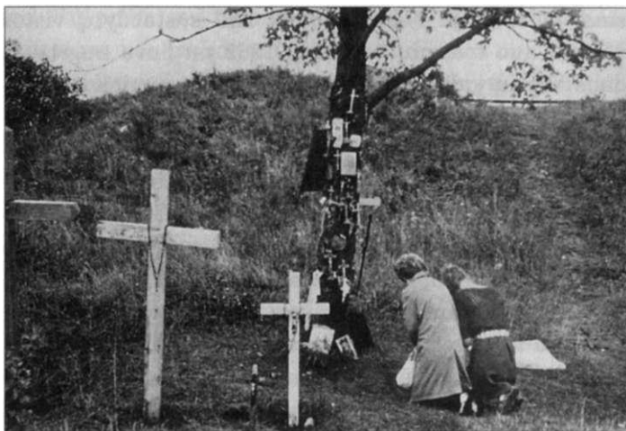
Kryžių kalnas, 1966 m. (LCVA VGDS)

kryžių statymas Kryžių kalne, sovietų valdžios nuomone, ne tik turėjo religinę prasmę, bet ir aiškiai buvo susijęs su tautinio išsivadavimo viltimis. Pagaliau norėta sužinoti, kokios galima laukti tikinčiųjų reakcijos. Nors 1961 m. balandžio 5 d. įvykdyta kryžių likvidavimo operacija, per kurią buvo sunaikinti 2179 kryžiai 153 , sukrėtė aplinkinių rajonų gyventojus ir visos Lietuvos tikinčiuo-