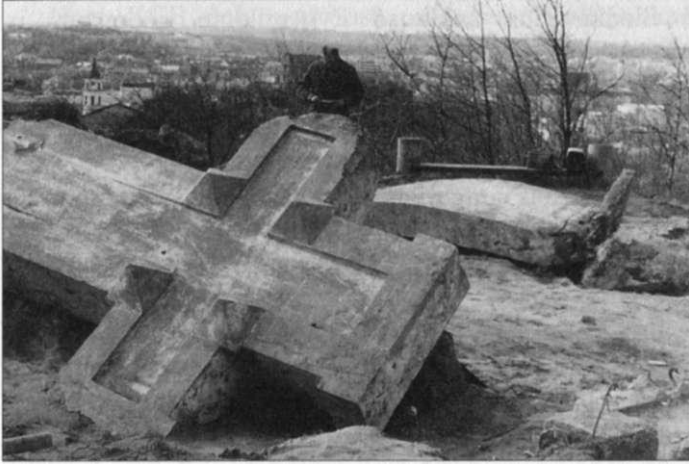
Archeologinių kasinėjimų metu atkasamas 1950 m. gegužės mėn. susprogdintas Trijų kryžių paminklas, 1988 m.