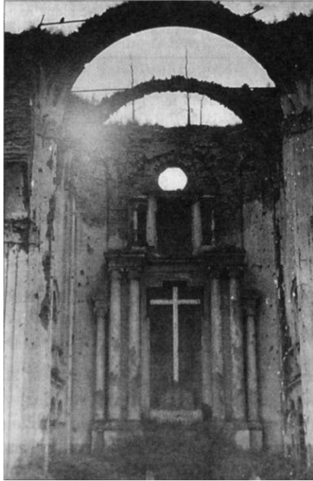
Senoji Sintautų bažnyčia, sugriauta per Antrąjį pasaulinį karą