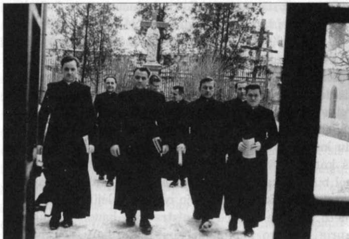
Kauno kunigų seminarijos auklėtiniai eina į paskaitas, 1964 m.

ateistinę propagandą mokslo argumentais, Maskvoje buvo įsteigtas Mokslinio ateizmo institutas (1982 m. Vilniuje buvo įkurtas tarprespublikinis šio instituto filialas), o 1966 m. pradėjo eiti žurnalas „Voprosy naučnogo ateizma“. Ypač daug dėmesio buvo skirta religijos sociologijai, kuri turėjo parodyti religingumo mažėjimą „brandaus socializmo“ visuomenėje.